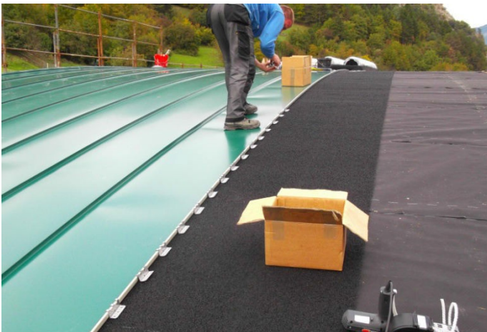
Copertura senza tensione. (Sistema SA)