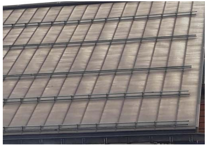
Coperture con evidenti tensioni dovute a materiale di fissaggio inadeguato.