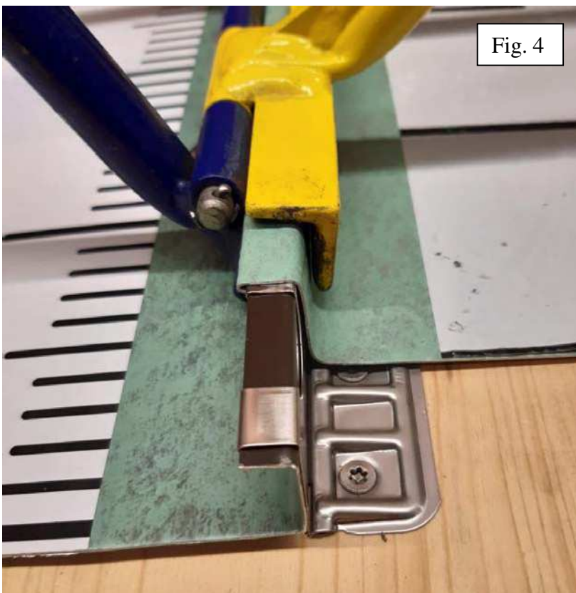
Dopo la chiusura della piega